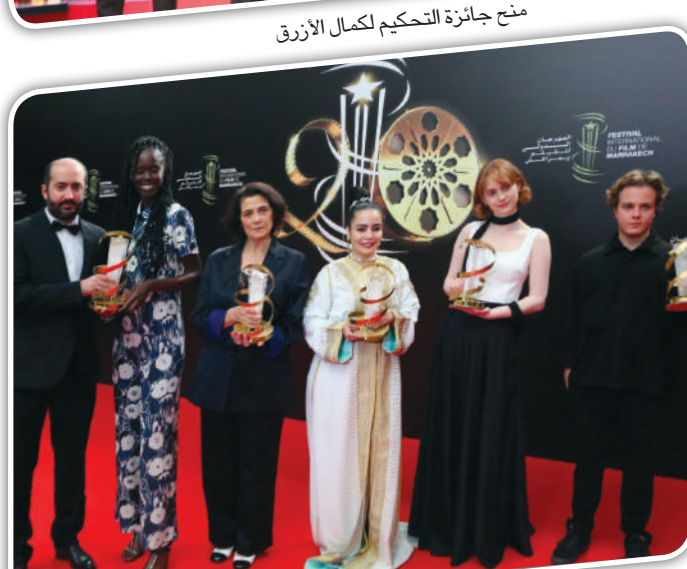
صورة جماعية للمتوجين في المهرجان

الدورة مشاركة أعداد كبيرة من الجماهير التي شاهدت عروض الأفلام وحضرت مختلف فقرات المهرجان، حيث تم اعتماد ما يقارب 21 ألف مشاركة حصلوا على بطاقتهم الإلكترونية بشكل مجاني. وكما هو الحال في كل سنة، شهد المهرجان مشاركة ما يقارب 8 آلاف طالب وطفل ومرافق من المنطقة، حضروا عروض الأفلام المرجلة في قسم «سينما الجمهور الناشئ»، من بينهم 750 طفلا ينحدرون من منطقة الحوز، وخصص المهرجان، للسبب تم تنظيمه رغم