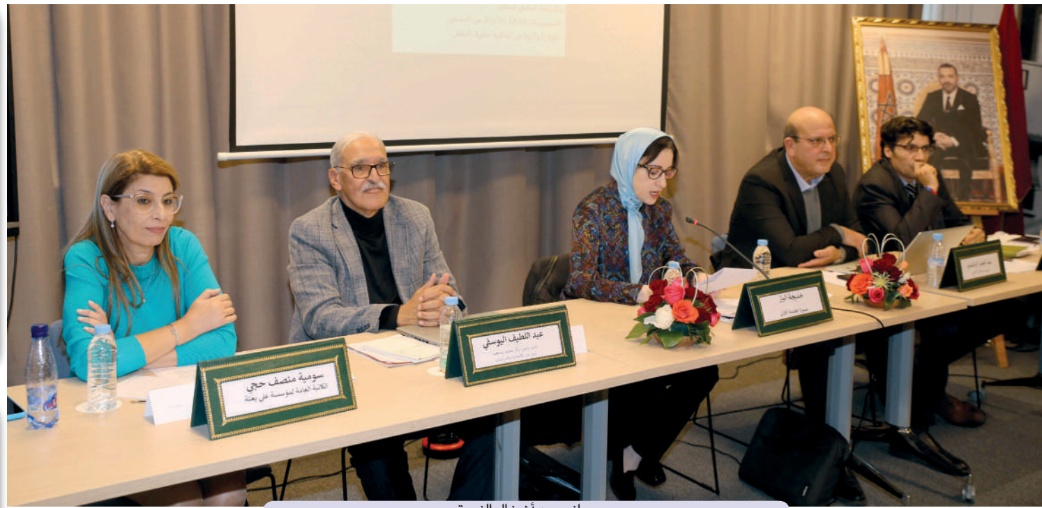
جانب من أشغال الندوة