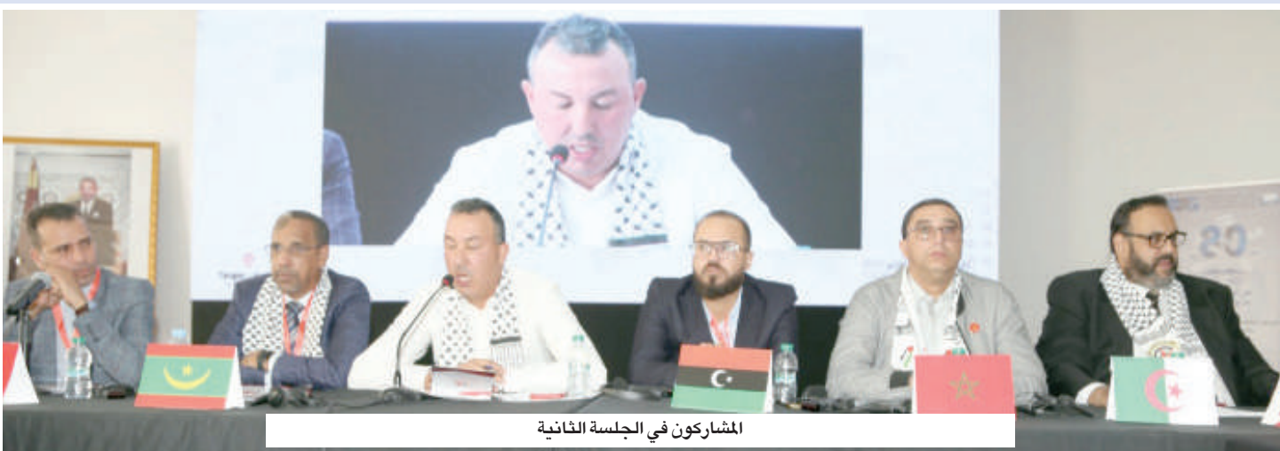
المشاركون في الجلسة الثانية