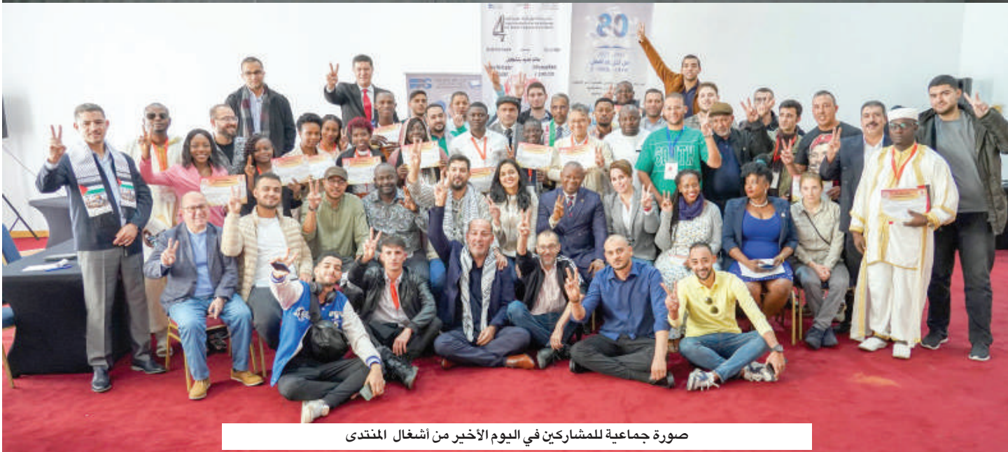
صورة جماعية للمشاركين في اليوم الأخير من أشغال المنتدى

ومشاريع تفكيك على البنية الجيوبولسية الراهنة. المحور الخامس:ليات التصدي والمواجهة بحث في الدلائل والخيارات الإستراتيجية المستقبلية المتاحة للمنطقة العربية.