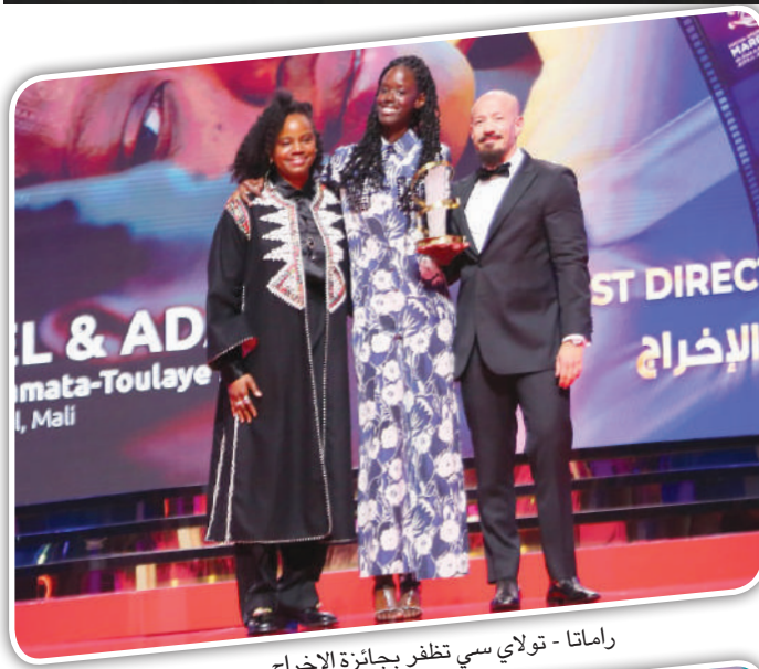
راماتا - تولاي سي تظفر بجائزة الإخراج

● مبعوث بيان اليوم الى مراكش: يوسف الخيدر