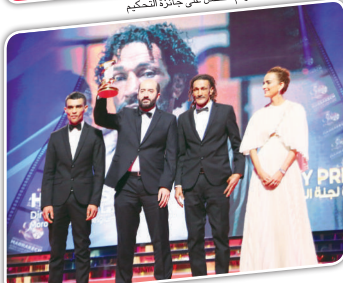
منح جائزة التحكيم لكمال الأزرق