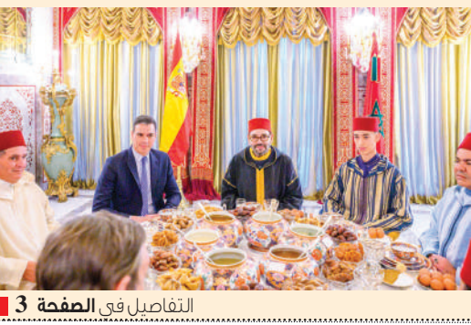
التفاصيل في الصفحة 3

المؤسس: علي يعته ■ مدير النشر: محمات الرقاص