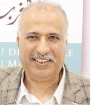
• شعر: عبد اللطيف الصافي

هُنَاكَ عند شلالِ الضوءِ والخَبْ أفراءة بوجهٍ ملائكي وإبتسامةٍ حُبلى بالفرح أفراءة جميلة أفئاداً قلبي بها زوجي التي أخرجها السُّوقُ، تطلبها عُنَيَّائِ الثَّمَلَتَانِ تُأديها شفتاي المبلَّتان بالشَّغْبِ تُبْحَثَانِ عُنْهَا أقولُ لك يا امرأة، أنتِ حُلْمٌ يلمُعُ في قلبي المُتَمَلِّئِ بالصفاءِ مِثْلَ فطرَةِ ندى تختُ أشعةَ الشَّمْسِ الدَّافئةِ أنتِ خبَاءةٌ وأنا طَمَلُكَ العاشِقُ لا أملكُ القُدرةَ على إخفاءِ مشاعري لذلك سَأَكْتَبُ القَصيدةَ تِلْوَ القَصيدةِ من ديبِ وجعي ومن مَلْحِ مدْمعي يَسْأَلُونِي مَنْ تُكُونُ حبيبتُكَ التي تُتَرَعِّعُ على عُرْشِ قِصائِدِكَ هَمْزٌ لا يُعْرَفُونَ أَنَّكَ الوترُ الذي يَضَعُ نبضَ الماءِ في قلبي وأنتِ تُهَيِّدُهُ مُشْتَعِلَةٌ في كلِّ حَرْفٍ ونَقْطَةٍ وفاصِلَةٍ وأنتِ وحْدِكَ من تُوقِظِينِ سِرَّ البُوحِ في دمي تُحَرِّزِينِ حُلْمِي من قُبْضَةِ الظَّلامِ في اللَّيْلَةِ الفاصِلَةِ