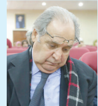
• بقلم: إدريس الملياني

2 وعلى الرغم من طول عمر لسان العرب الجميل والطويل، الممتد والمرند عبر جميع عصور «الجاهليات» والسباقت واللاحقات والباليات والحاليات، فإنه كما يبدو لم يترجم بعد من روائع المطابع إلا القليل الجميل، ولم ينقل عن السنة التواع والزوايع غير ما تيسر من أسفار الحمار وأثار الجنة والنار والناس. وتحفل المرويات والمدونات بما وقع فيه النقل الحر "الغوري" الحرفي والعقل الثقلي "التحريفي" والجهل بالأصل النصي المترجم والمنقول - كالماء من إناء إلى وعاء آخر، لا بد أن يضع منه ماء كثير أو قليل، وقد يفيض السيل أو يفيض النبع وينقطع الوابل الضئيل والطل وينضب المعين ويجف ضرع السماء فيأتي على الأخضر والباس ما يجري ويستشري في الجسد النصي والشخصي من أخطاء اللغو والنحو والصرف والإملاء، الواضحة والفاضة والفاحة، كالتقل والصناب. ويتساوى في "جريمة" الترجمة الخائنة الأمانة والأمانة الخائنة، الناسخ المسوخ، والنسخ المسوخ، والعالم والجاهل بالأصل النصي، على حظ واحد وقدر واحد من الإنم والدوران. وكذلك حال ومال ترجمة عن ترجمة أخرى، وسيطة اللغة، الثانية والثالثة، تماما كترجمة مختصرة ملخصة ومبورة ومختزلة، وترجمة أخرى مفسرة شارحة محملة ومفصلة، كلها ترجمات قاصرة وضامرة وصادرة عن ناسخ " ماسخ بليس الترجمة ثوبا يرتضيه لنفسه، فينقلب بالمعاني على ما يطابق بغيته، ويوافق خطته، حتى لا يبقى للأصل أثرًا" على حد قول كاتب "فن الترجمة في الأدب العربي محمد عبد الغني حسن ص 65"، ويتأكد عميد الأدب العربي عبد حسين فلا قيمة للترجمة إلا إذا كانت طبق النص الأصلي: "أرى أن ليس للترجمة قيمتها حقًا إلا إذا كانت صورة صحيحة للأصل" - حافظ وشوقي ص 91. يتبع